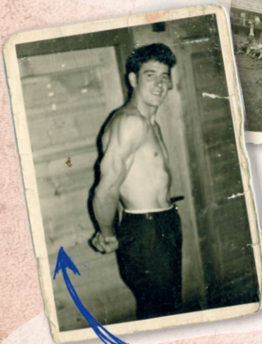
9 focher Londesmasta Rauter Werner